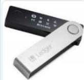
Криптокошелек Ledger Nano X... 15 990 ₺ re:Store