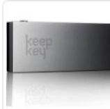
Keepkey (Кипкей) аппаратный... 6 199 ₺ Cryptonist