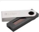
Аппаратный кошелек Ledger... 6 690 ₺ Cryptonist