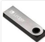
Аппаратный криптокошелек... 7 490 ₺ Wildberries.ru